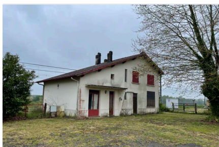
L'ancienne gare appartient à la SNCF.