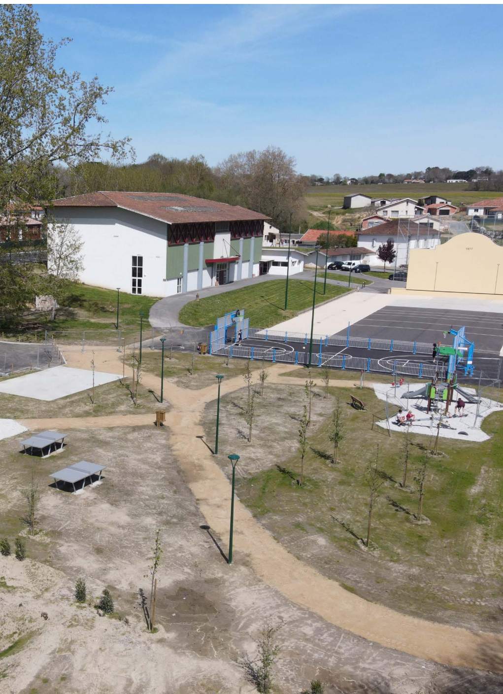
De nouveaux aménagements qui ont déjà trouvé leur public.