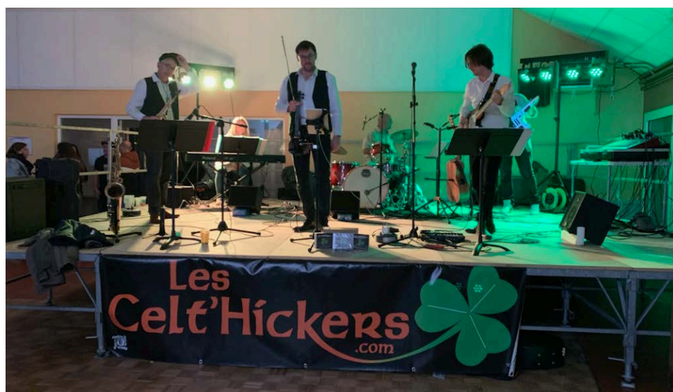
Une soirée placée sous le signe du trèfle et du houblon.

Après une mémorable Saint-Patrick, le comité des fêtes de Rivière se projette dans les prochaines fêtes de village... Avec vous ?