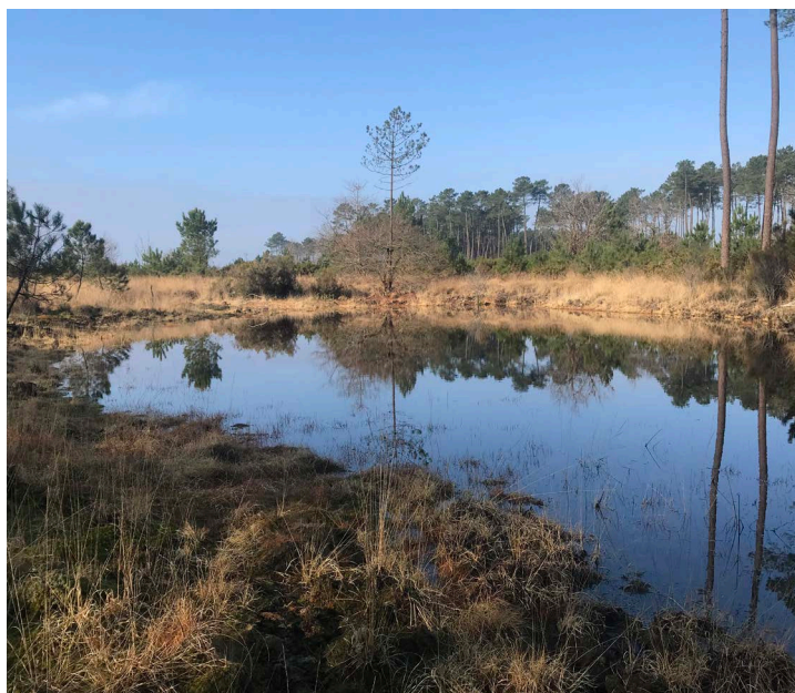
Une zone naturelle humide à préserver.

Les lagunes sont des espaces naturels humides, dont la faune et la flore sont très typiques. On peut en observer une à Rivière, à proximité de la déchetterie !