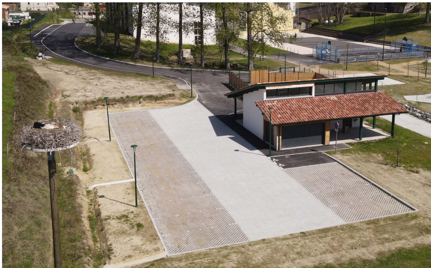
Chasseurs, boulistes, tout le monde est le bienvenu à la Maison de la Nature.

Adoptée par les chasseurs et les boulistes, la Maison de la Nature va se prêter à une multitude d'usages, au service des associations comme des particuliers.