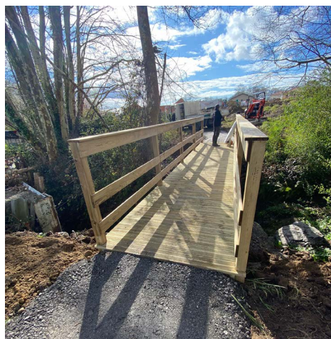
Liaison douce sur le lotissement Ura 2.