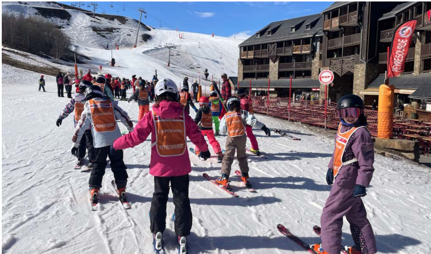
43 enfants au pied des pistes.

Enrichir le parcours des élèves, c'est l'objectif commun des enseignants, parents et acteurs locaux et institutionnels de la vie sportive et culturelle.